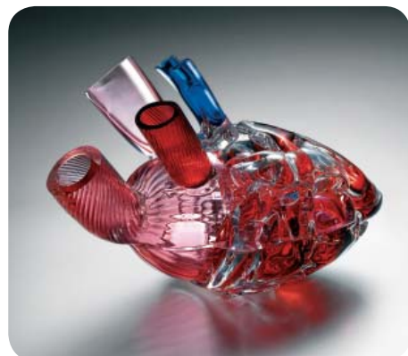
1-е место "Посуда с крышкой", 2007 Dirty Design Studio – Чешская Республика