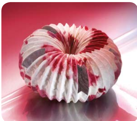
1-е место "Банка для печенья", 2008 Стефан Гудев – Чешская Республика