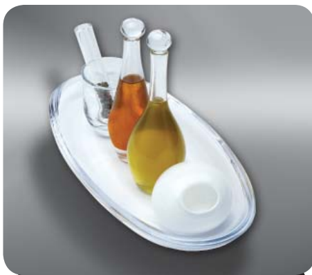
1-е место "Набор для масла и уксуса", 2005 Мари Раам – Австрия