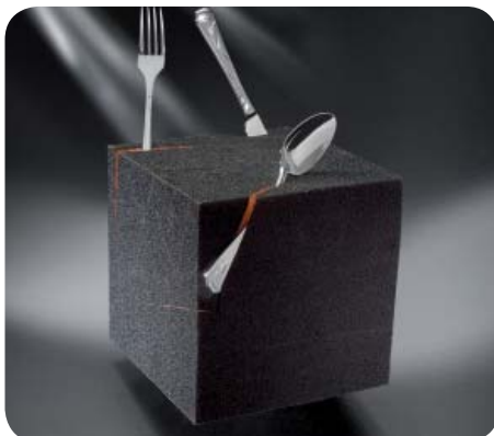
1-е место "Коробка для всего и для ничего", 2011 Леона Матейкова – Чешская Республика