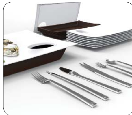
1-е место "Столовые приборы для рыбы и морепродуктов", 2013 Жанмарко Бруначчи – Лука Зеноби – Италия