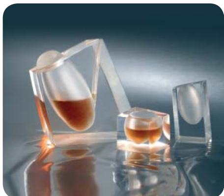
1-е место "Чай для двоих", 2009 Небойша Момчилович – Сербия