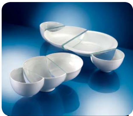
1-е место "Комплект для закусок", 2006 Каталин Томай – Венгрия